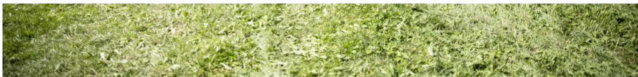
Die Vorbereitungen auf dem Festgelände laufen auf Hochtouren. Sarah Neuhaus